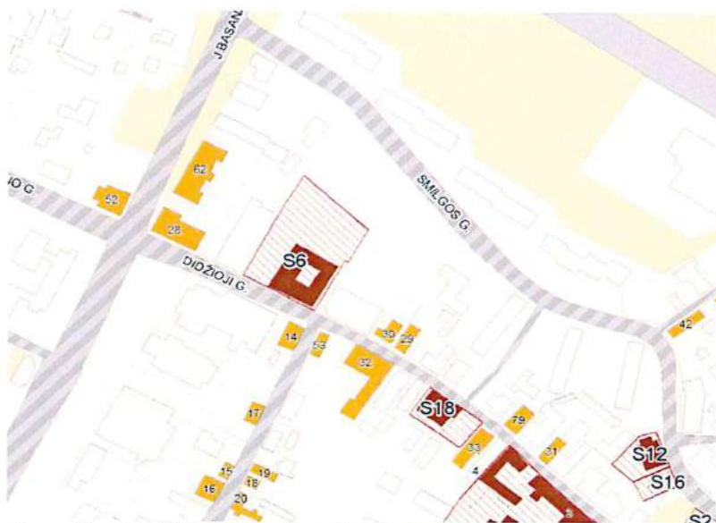
4 pav. Ištrauka iš Kėdainių miesto bendrojo plano brėžinio Kultūros paveldo, senamiesčio teritorijos naudojimo reglamentai