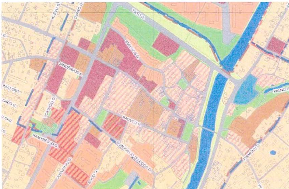
2 pav. Ištrauka iš Kėdainių miesto bendrojo plano Pagrindinio brėžinio

Kėdainių miesto bendrasis planas patvirtintas 2010 m. rugsėjo 24 d. Kėdainių rajono savivaldybės tarybos sprendimu Nr. TS-274, Reg. Nr. 01001300619.