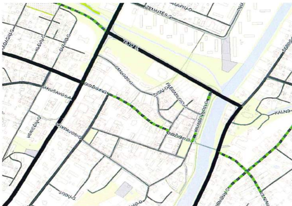
5 pav. Ištrauka iš Kėdainių miesto bendrojo plano Susisiekimo brėžinio

Nagrinėjamą teritoriją riboja B kategorijos J. Basanavičiaus gatvė, C kategorijos Smilgos gatvė ir pagal Kėdainių miesto bendrojo plano susisiekimo dalį planuojama C kategorijos Didžioji gatvė (šiuo metu dalis Didžiosios gatvės yra D kategorijos. 73-ąjį senamiesčio kvartalą nuo 72-ojo skiria siauras pravažiavimas (rengiant detalų planą juos galėtų atskirti D kategorijos vienpusio eismo gatvė, kurios plotį apribos esamas užstatymas).