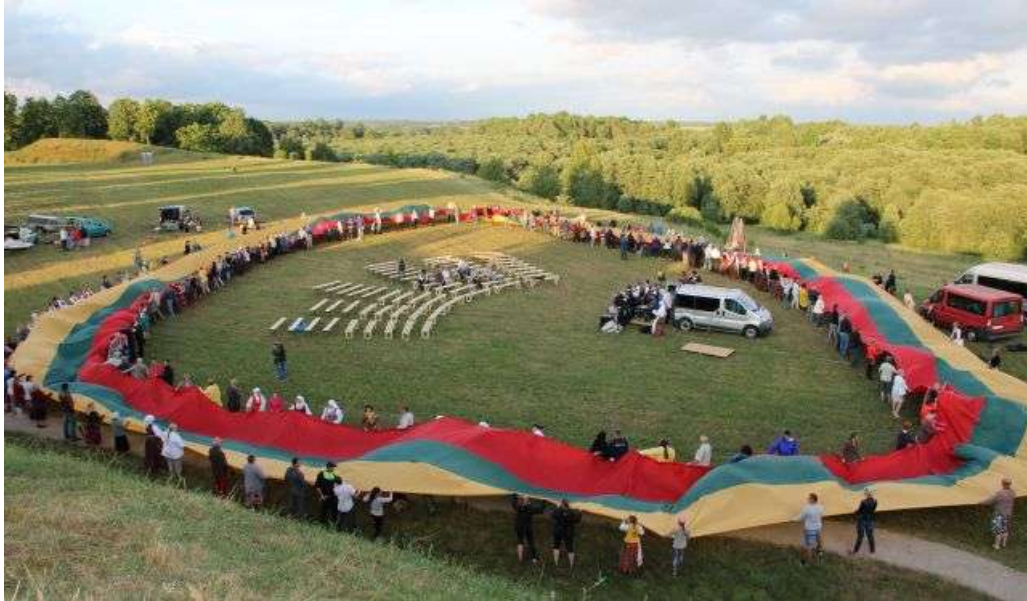
Nuotr. Prie Bakainių piliakalnio paminėta Valstybės (Mindaugo karūnavimo) diena