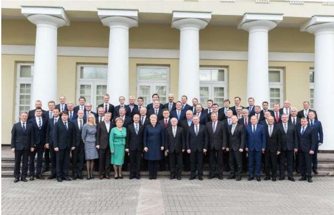
Nuotr. Šalies savivaldybių merai – su LR Prezidente D. Grybauskaite

2015 metų balandžio 27 d., Lietuvos Respublikos Prezidentė Dalia Grybauskaitė, susitiko su naujos kadencijos savivaldybių vadovais , tarp kurių – ir Kėdainių rajono meras Saulius Grinkevičius, aptarė regionų problemas ir pagrindinius naujų merų darbus.