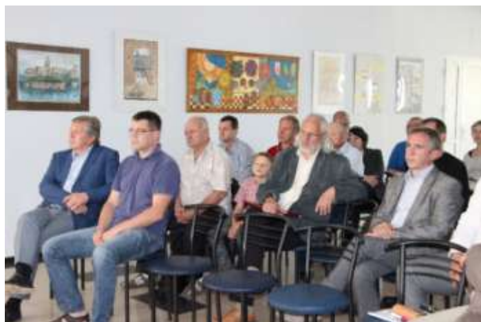
Nuotr. Kėdainių kultūros centro rekonstrukcijos projekto pristatymas