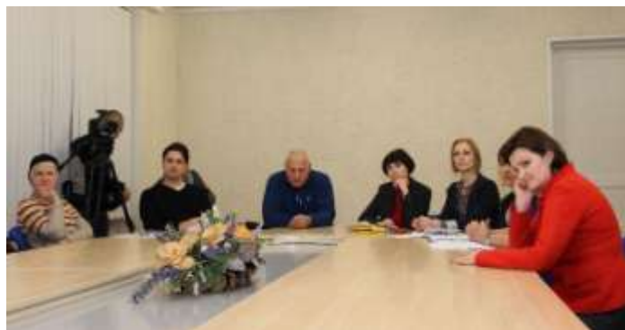
Nuotr. Metų pabaigoje rajono savivaldybėje surengtas pirmasis susitikimas su užsienyje gyvenančiais kraštiečiais