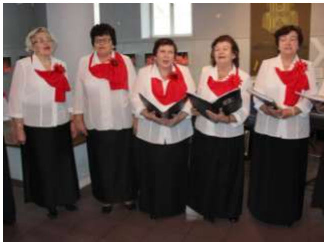
Nuotr. Kėdainių lenkų draugija atšventė penkiolikos metų gyvavimo sukaktį