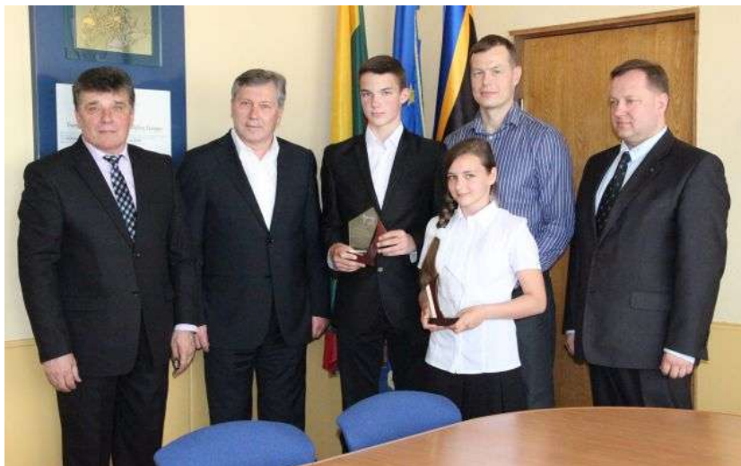
Nuotr. Jaunųjų kyokušin karate klubo „Stoikas“ sportininkų ir trenerių pagerbimas