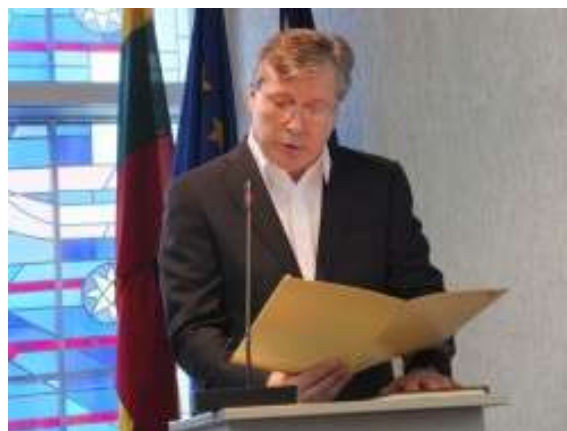
Nuotraukoje Kėdainių rajono savivaldybės meras Saulius Grinkevičius

Vykdydamas Lietuvos Respublikos vietos savivaldos įstatymo 20 straipsnio 3 dalies 7 punktą ir Kėdainių rajono savivaldybės tarybos veiklos reglamento 198 straipsnį, Savivaldybės meras pateikia tarybai metų veiklos ataskaitą. Teikiu 2015 metų (nuo 2015 m. balandžio 17 d.) veiklos ataskaitą.