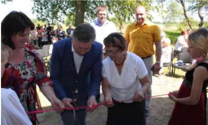
Nuotr. Pilionių bendruomenės namų atidarymo akimirka

Rajono vadovas džiaugėsi, kad mūsų krašto bendruomenės sugeba pasirinkti ir įgyvendinti labiausiai joms reikalingus projektus. Naujieji šios bendruomenės namai įsikūrė renovuotame šešeiminkiaame bute trijų butų name.