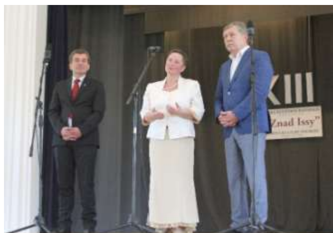
Nuotr. Lenkų kultūros festivalio „Znad Issy“ metu sutarta stiprinti dvišalį bendradarbiavimą