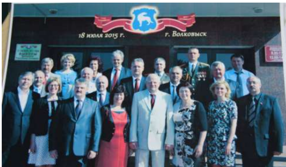
Nuotr. Kėdainių rajono savivaldybės delegacija su oficialiu vizitu lankėsi Baltarusijoje

Mūsų rajono delegacija pasveikino jubiliejinės 1010-ąsias įkūrimo metines švenčančio Valkavisko miesto vadovus ir bendruomenę. Kėdainiečiai dalyvavo įvairiuose šventiniuose renginiuose, vietos įmonių gaminamos produkcijos parodoje, pažintinėje ekskursijoje po Valkaviską.