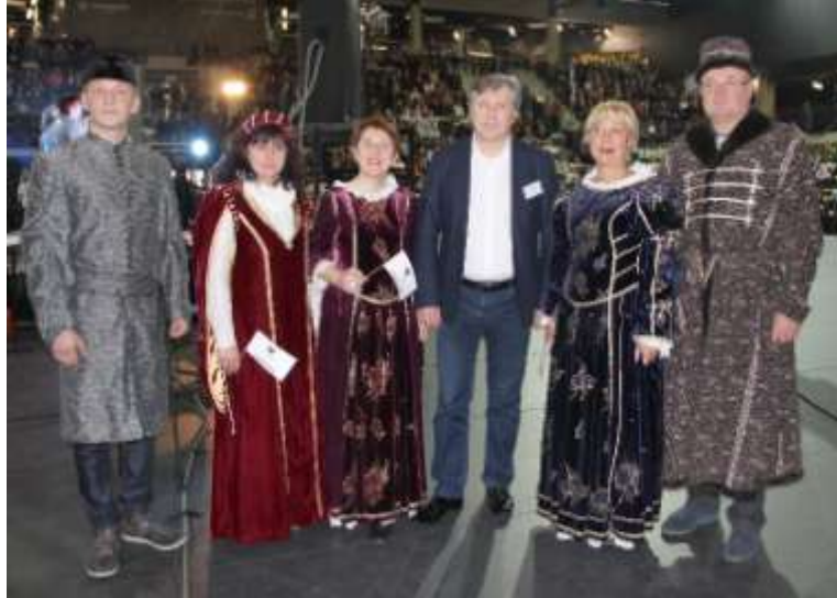
Nuotr. Nacionalinė bendruomenių šventė-sąskrydis „Tai mes!“