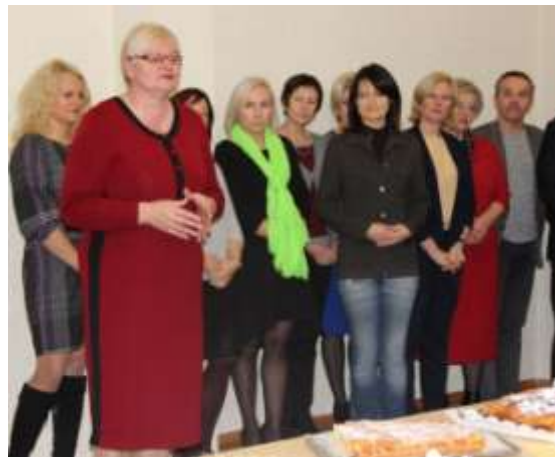
Nuotr. Pirmą kartą Kėdainių rajono savivaldybėje surengta Pyragų diena