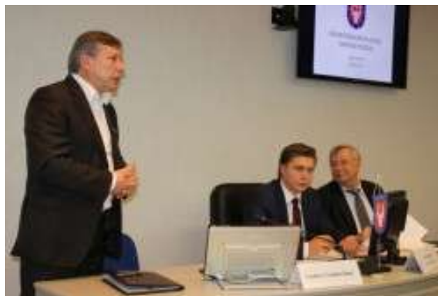
Nuotr. Kėdainių rajono savivaldybėje surengtas Kauno regiono plėtros tarybos posėdis

2015 m. spalio 20 d. Kauno regiono plėtros tarybos posėdis įvyko Kėdainių rajono savivaldybėje. Posėdyje buvo sprendžiami techniniai dalykai dėl iš Europos Sąjungos projektų likusių lėšų grąžinimo, taip pat aptartos naujojo finansinio laikotarpio galimybės ir kai kurių tikslinių teritorijų finansavimas. Naujojo Europos Sąjungos finansavimo metu savivaldybės į įvairius projektus investuos daugiau lėšų. Bus įgyvendinta daugiau nei dvidešimt skirtingų priemonių. Posėdžio metu aptarti svarbūs dalykai – Europos Sąjungos fondų investicijų planavimas Kauno regione ir patvirtintas Kauno regiono plėtros planas iki 2020 metų. Taip pat buvo aptartas mažų miestų, miestelių ir kaimų asignavimų paskirstymas (2015 m. spalio 20 d. Kauno regiono plėtros tarybos posėdžio protokolas Nr. 51/2P-10).