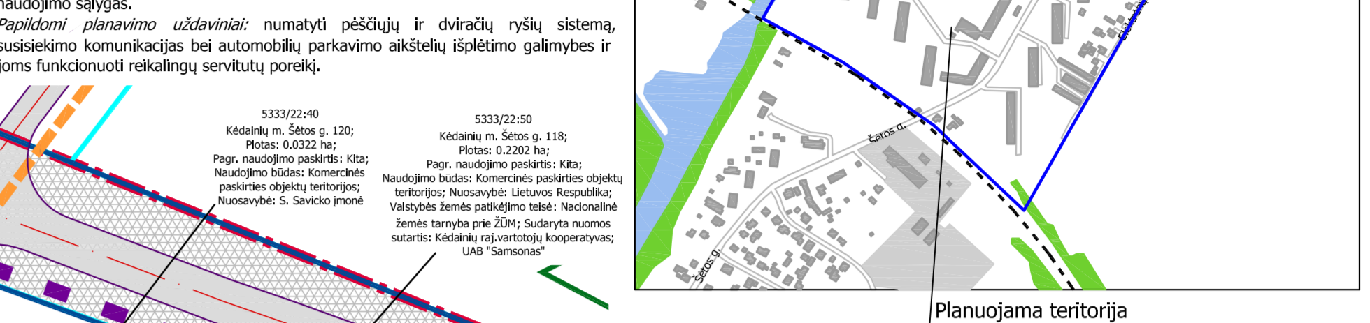
Objekto išsidėstymo schema

Detaliojo plano organizatorius: Kėdainių rajono savivaldybės administracijos direktorius, J. Basanavičius g. 36, LT-57288 Kėdainiai. Detaliojo plano rengėjas: UAB "Dujų sfera", Draugystės g. 19, LT-51230 Kaunas Planuojamos teritorijos plotas: apie 18,00 ha Detaliojo plano rengimo pagrindas: Kėdainių rajono savivaldybės administracijos direktoriaus 2014 m. lapkričio 12 d. įsakymas Nr. AD-1-1285 "Dėl septinių Kėdainių miesto daugiabučių gyvenamųjų namų kvartalo detaliojo plano rengimo". Planavimo uždaviniai: numatyti optimalią urbanistinę struktūrą, suformuojant sklypus prie esamų daugiabučių gyvenamųjų namų ir suplanuojant sklypus susisiekimo ir inžinerinių tinklų kordonus, želdynų ir (ar) bendro naudojimo teritorijas. Numatyti jų naudojimo tipą ir kitus teritorijos naudojimo reglamentus, suregulius žemės naudojimo sąlygas. Papildomi planavimo uždaviniai: numatyti pėsčiųjų ir dviračių šviestų sistemą, susisiekimo komunikacijas bei automobilių parkavimo aikštelių galimybes bei joms funkciniai reikalingų servitų poreikį.