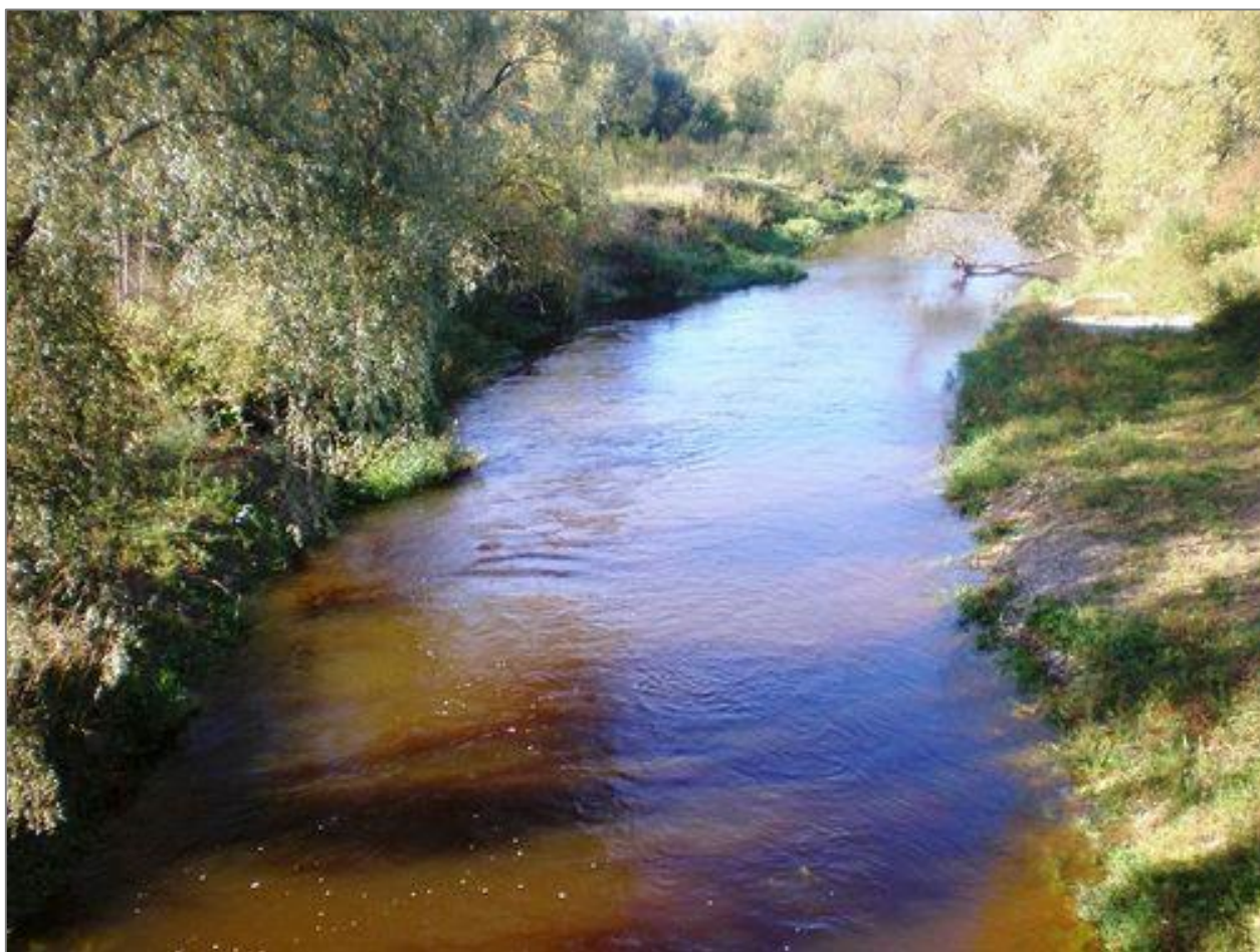
3 pav. Obelies upė

Svarbiausia draustinio upė — Nevėžio kairysis intakas — Obelis (3 pav.), prasideda Ukmergės rajone, netoli Siesikų miestelio. Upė teka Kėdainių rajonu, pietvakarių ir vakarų kryptimis. Įteka į Nevėžį 55,6 km nuo jo žiočių, 2 km į pietvakarius nuo Kėdainių. Upės ilgis — 53,3 km., baseino plotas — 673,8 kv.km.