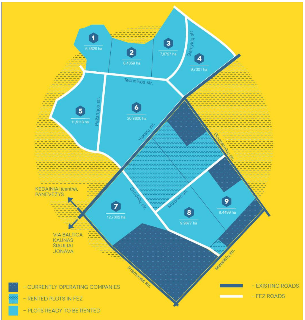
3 pav. Kėdainių laisvoji ekonominė zona

subjektams tinkamai vykdyti veiklą, svarstyta Draustinio ribos korektūra centrinėje Draustinio teritorijos dalyje.