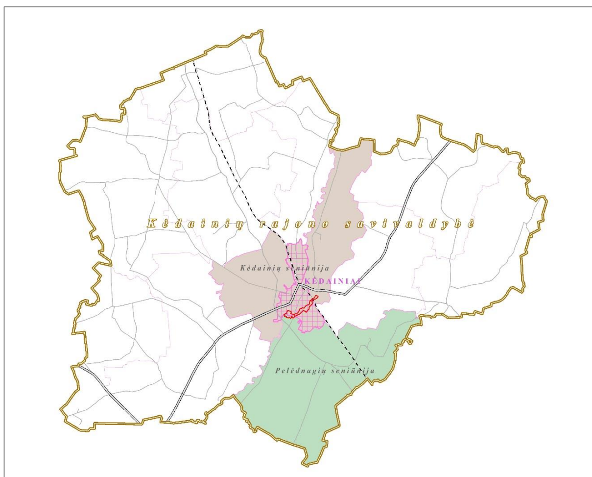
1 pav. Draustinio padėtis Kėdainių rajono savivaldybėje

Draustinis yra vidurio Lietuvoje, centrinėje Kauno apskrities Kėdainių rajono savivaldybės dalyje (1 paveikslas), Kėdainių ir Pelėdnagių seniūnijose. Didžiausia Draustinio dalis yra Kėdainių seniūnijoje — 138,91 ha. Pelėdnagių seniūnijoje yra 32,31 ha. Draustinio teritorija driekiasi Obelies upės žemupio slėnyje nuo Juodkiškių tvenkinio iki santakos su Nevėžiu. Savivaldybės saugoma teritorija plyti intensyviai urbanizuotoje vietovėje — iš šiaurės pusės Draustinį juosia Kėdainių miesto gyvenamosios ir gamybinės teritorijos, iš pietų — pramoninis Kėdainių rajonas ir Paobelio kaimas. Draustinį (taip pat Obelies upę) kerta Juodkiškio ir Kauno gatvės, geležinkelis Jonava — Radviliškis. Draustinio situacijos schema pateikiama 2 pav.